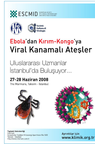
Görsel 2. Ebola'dan KKKA'ya Afişi, 2008