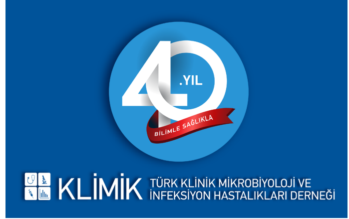
Görsel 1. 40. Yıl Logosu.

2006 yılında Marmara Üniversitesi'nde göreve başlamamla birlikte dernek çalışmalarına daha aktif katıldım. 2008 yılında KLİMİK Derneği'nin desteğiyle düzenlediğimiz "Viral Kanamalı Ateşler" konulu Avrupa Klinik Mikrobiyoloji ve İnfeksiyon Hastalıkları Derneği (European Society of Clinical Microbiology and Infectious Diseases, ESCMID) Mezuniyet Sonrası Toplantısı, bu sürecin önemli dönüm noktalarından biri oldu (GÖRSEL 2: toplantı poster). Bu toplantı vesilesiyle hazırladığımız İstanbul'un Tıp Tarihi İçin Gezi Rehberi başlıklı kitap (GÖRSEL 3: Kitap kapağı) ise derneğimizin ilk İngilizce yayını oldu. Daha sonra, Acinetobacter İnfeksiyonları (2009), İnfluenza (2010), Bruselloz (2010), Yeni Salgınlar (2023) ve Kan Dolaşımı İnfeksiyonlarında Hızlı Tanı (2025) başlıklı ESCMID mezuniyet sonrası eğitimleri düzenlendi.