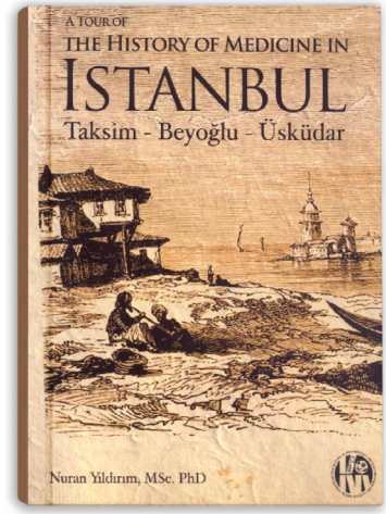
Görsel 3. İngilizce Tarih Kitabı, 2008